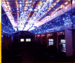
11日/風船匠じょにい